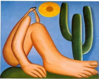
1- Abaporu. (Disponível em: https://brasilecola.uol.com.br ).

29. Observe as imagens e assinale a alternativa que corresponde ao número da obra que representa o movimento Land Art.