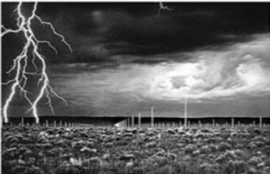
2- Campo Relampejante de Walter de Maria. (Disponível em https://www.google.com/ ).